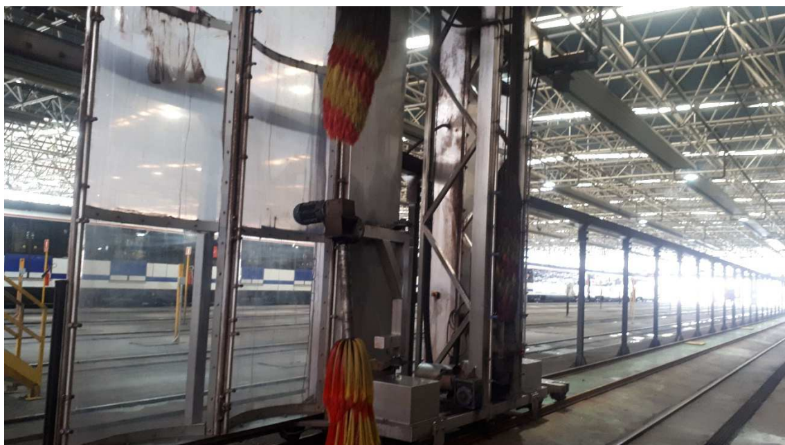
Situación actual del equipo